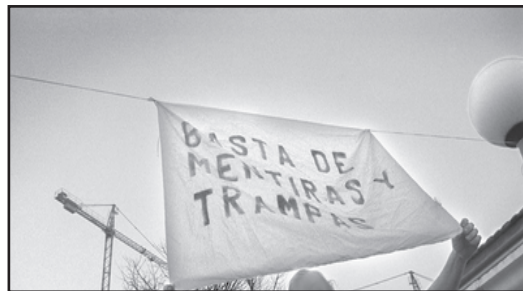
Una de las pancartas de las primeras movilizaciones de los Avis del Barri en el año 2004.

AVIS DEL BARRI es una asociación sin ningún ánimo de lucro, sólo al servicio del barrio y por el barrio. Esperamos que aportéis vuestras opiniones, estamos para poder ayudaros. Para más información todos los martes en el centro cívico local de reuniones de los Avis de 19h hasta las 20h.