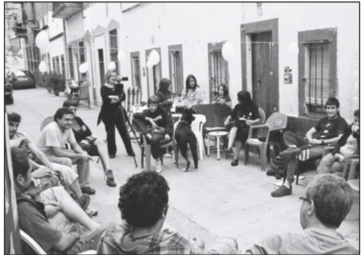
Trobada veïnal el 15 de juny de 2008 a la Colònia Castells