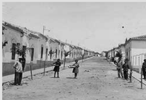
Foto antigua de "Plaza Italia", barrio de casas baratas en Cáceres. Hoy se ha convertido en un barrio chic, y las casas se venden por 240.000 euros.

Barrio "Población Huemul" de Casas Baratas en Santiago de Chile. Ya desde principios de siglo se tiraron los "conventillos", asentamientos de barracas, para edificar estos barrios.