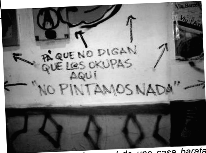
Una pintada en la pared de una casa barata de Buen Pastor, realizada durante una acción "okupa" en el año 2007.

La "okupación" de que hablamos aquí no es diferente de todo eso, si no por el hecho que en vez de hacerlo sin hacerse notar, lo que se intenta es declararlo, poniendo las banderas y los símbolos, para "visibilizar", es decir que la gente se dé cuenta de que hay muchas casas vacías y mucha gente sin casa. Pero esto también tiene precedentes históricos: en Buen Pastor en los ochenta hubo un episodio en qué 15 familias ocuparon todas juntas algunas casas para