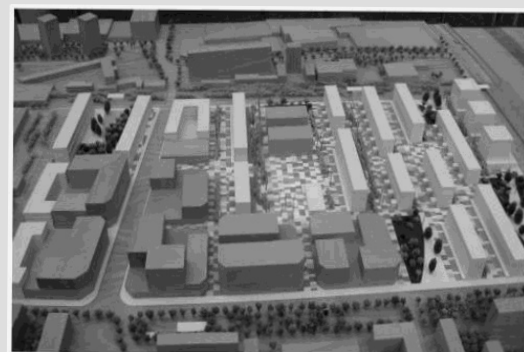
El barrio como quedará: una ciudad dormitorio de pisos-chapuzas. Para la maqueta, sí que se gastaron la pasta!

El viernes llamé al Patronato porque tenía humedades en la habitación de matrimonio, en el lado del interior; a parte, tenía las racholas del lavabo a punto de caerse, y grietas por todo el piso: hasta grietas de tres centímetros. Hablando con los vecinos de mi bloque me dí cuenta de que todos estamos igual: a parte de tener problemas de cucarachas (no decían que era porque las casas eran viejas?) todos los pisos tienen grietas, las racholas se caen... los materiales con que hicieron estos pisos son de tercera calidad, y están tan deteriorados después de sólo tres años, que - según nos dijo un paleta - tendrían que derribarlos y volverlos a hacer de nuevo.