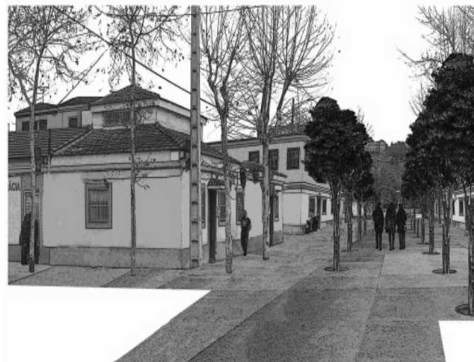
Dibujos extraídos de las propuestas presentadas al Concurso de Ideas

La crisis económica nos está afectando profundamente: muchas familias no podemos pensar en comprar pisos, y el Ayuntamiento no tiene ya el dinero para tantas obras. Los habitantes del barrio tenemos que empezar a organizarnos para estudiar otras alternativas, menos destructivas y más respetuosas con nuestra historia y con nuestras casas.