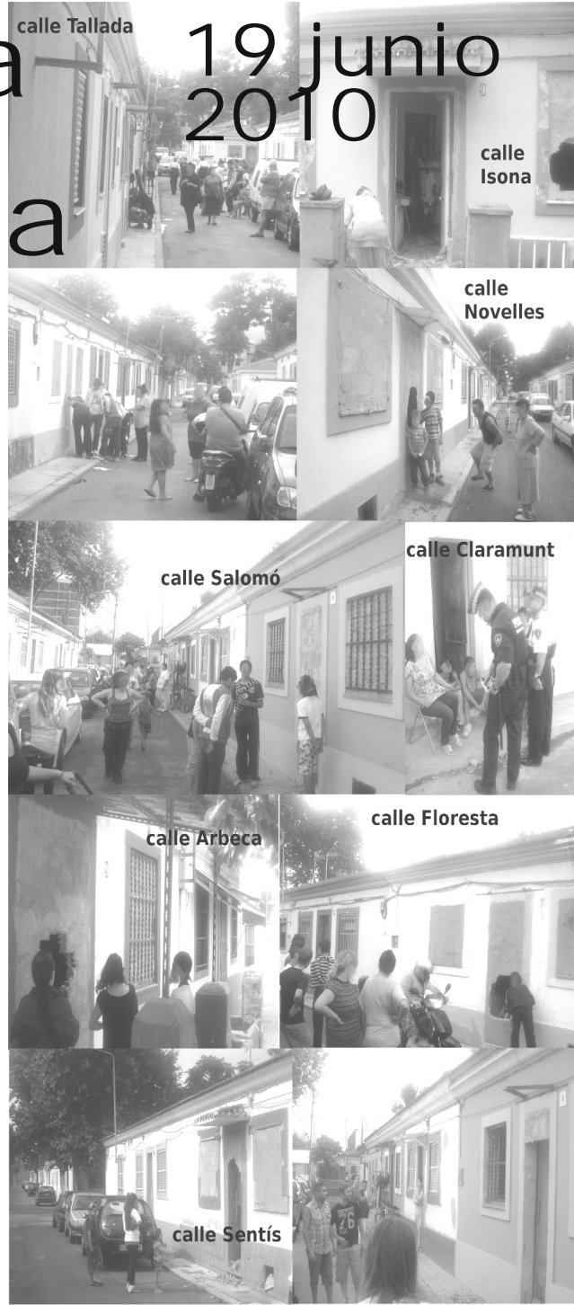
fotos y crónicas en Indymedia Barcelona: http://barcelona.indymedia.org/newswire/display/397164